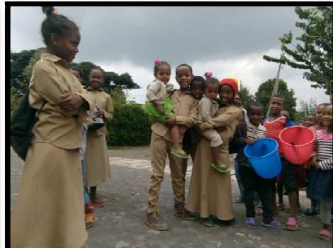
Les collégiens et les maternelles à la rentrée