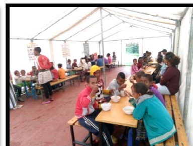
La nouvelle cantine