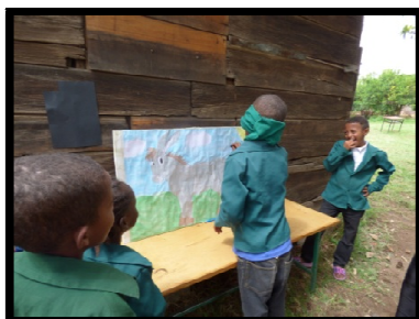
« Journée des enfants »