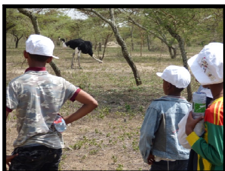
Voyage scolaire au parc Abiata